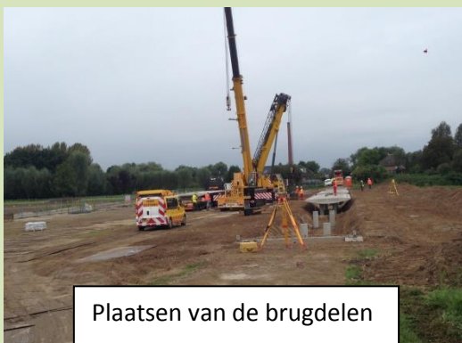
Plaatsen van de brugdelen