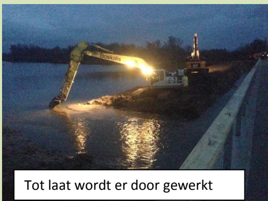
Tot laat wordt er door gewerkt

9 februari in de middag vindt de feestelijke opening van de brug plaats. De bewoners op Fortmond hebben hiervoor een uitnodiging per mail ontvangen.