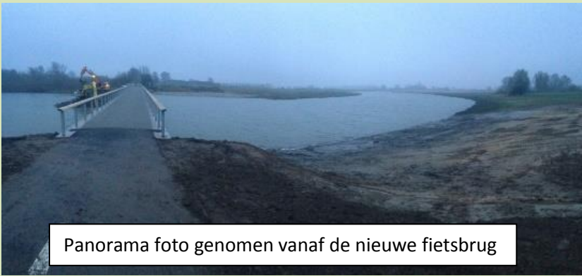
Panorama foto genomen vanaf de nieuwe fietsbrug