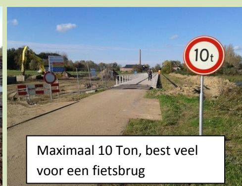
Maximaal 10 Ton, best veel voor een fietsbrug