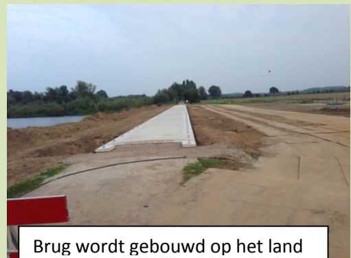
Brug wordt gebouwd op het land